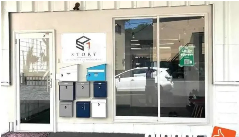
Itコンサルタント西澤塾 倉敷市