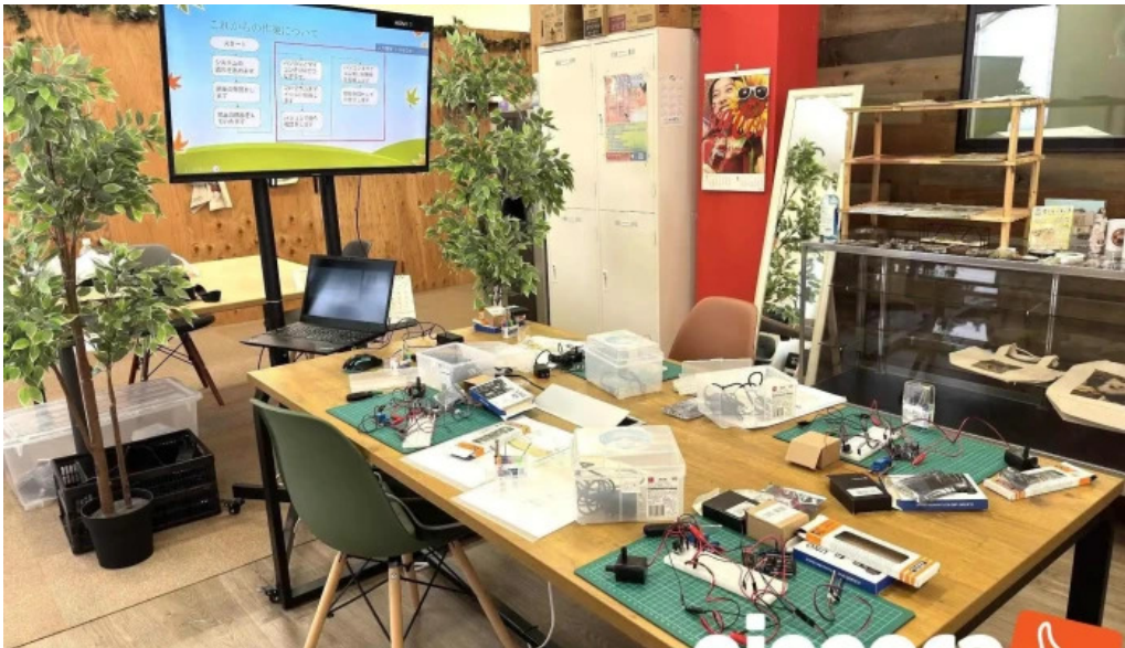
ItkonsarutantoXi Ze Shu o na Ti Gong