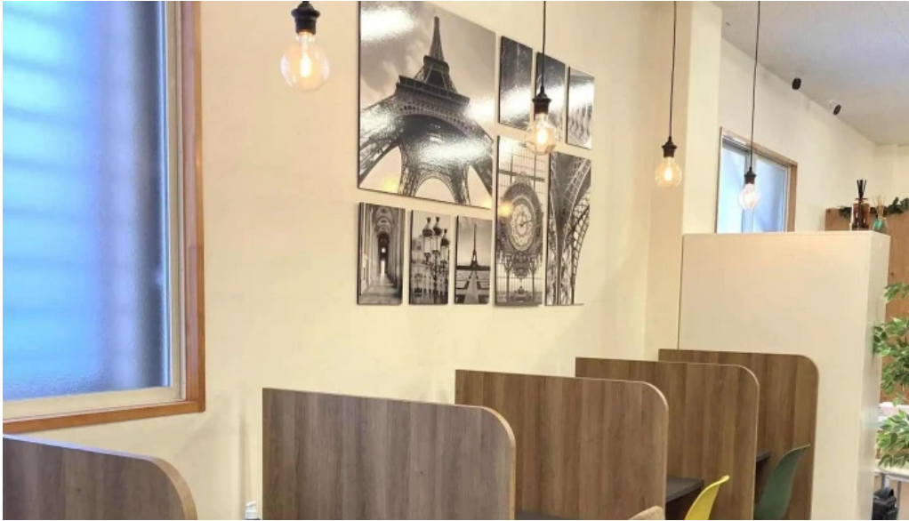
ItkonsarutantoXi Ze Shu 倉敷市