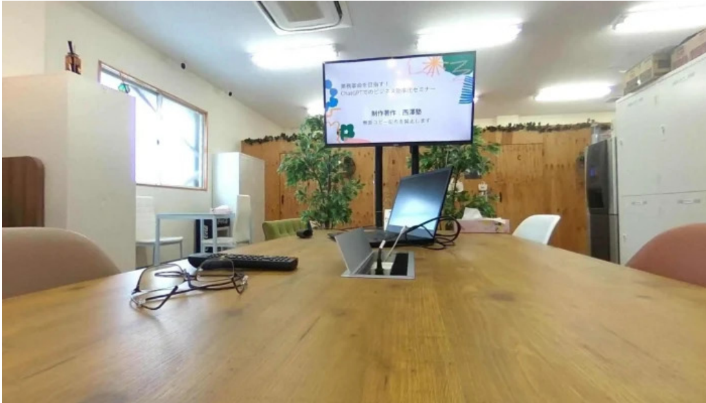
ItkonsarutantoXi Ze Shu sutori tobiyu to 360 biyu