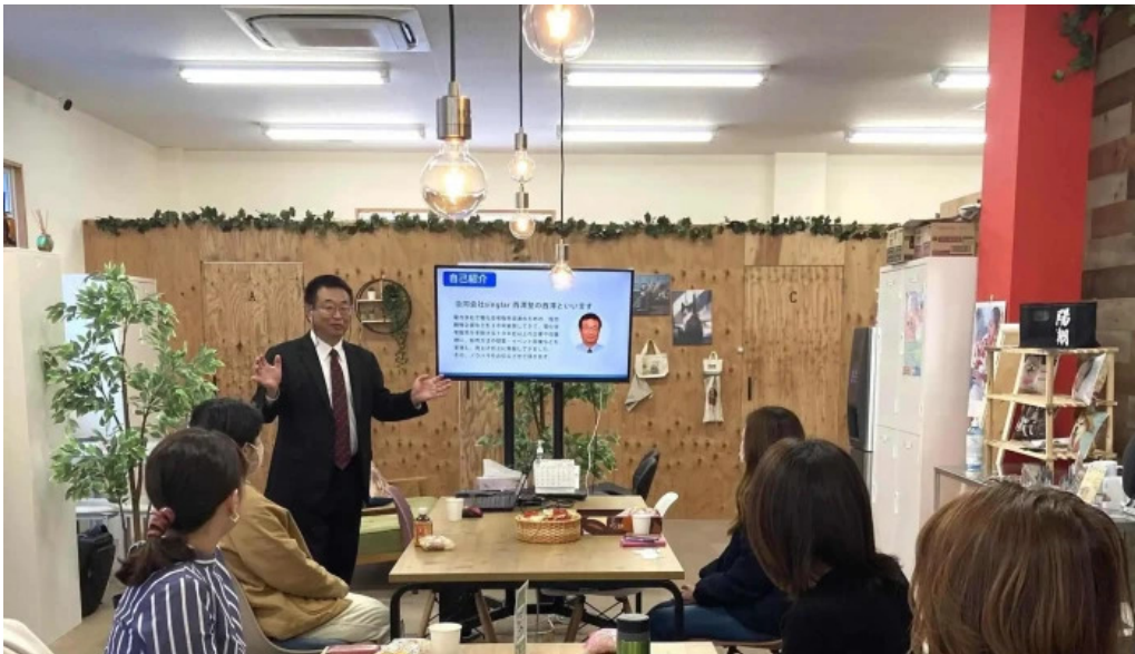
ItkonsarutantoXi Ze Shu it コンサルタント