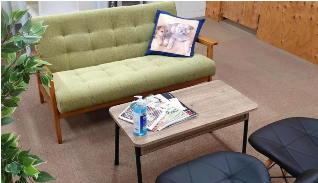
ItkonsarutantoXi Ze Shu どこ