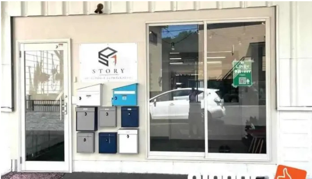
ItkonsarutantoXi Ze Shu subete