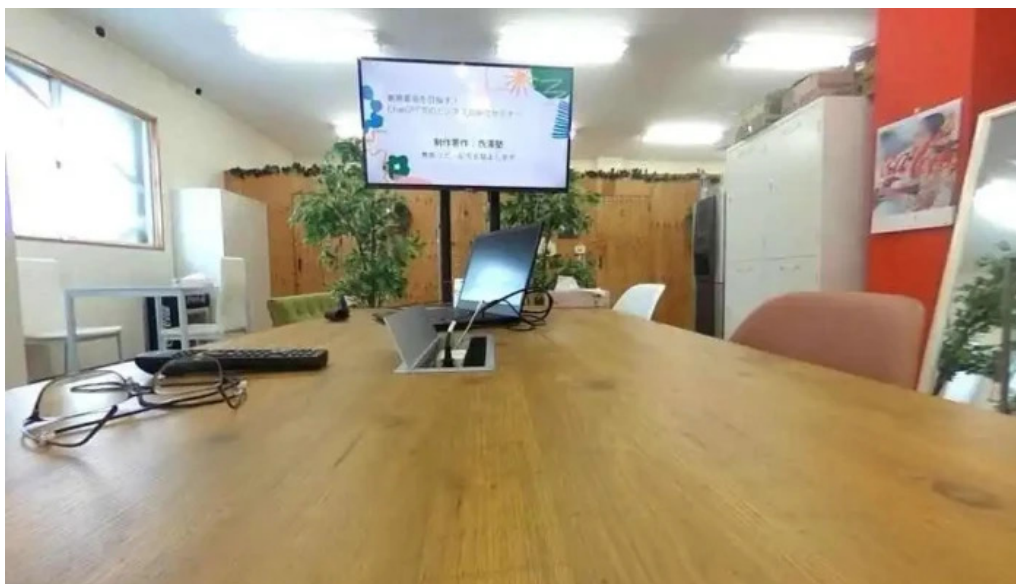
ItkonsarutantoXi Ze Shu Wu Nei