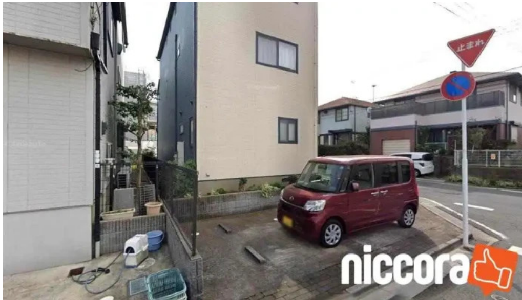
Itコンサルティングのオンデマンド 市川市