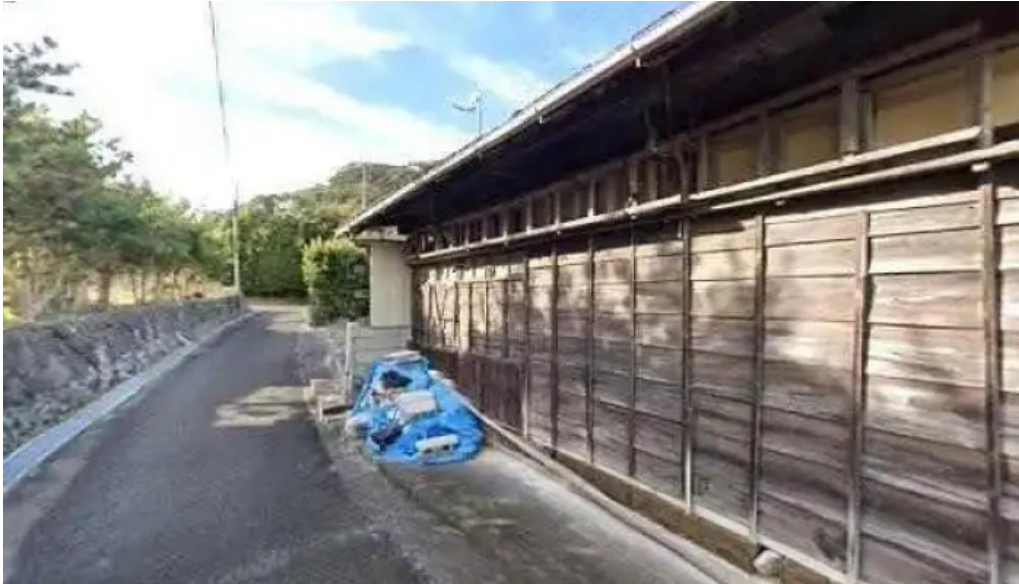
Zhu Shi Hui She bezidepo subete