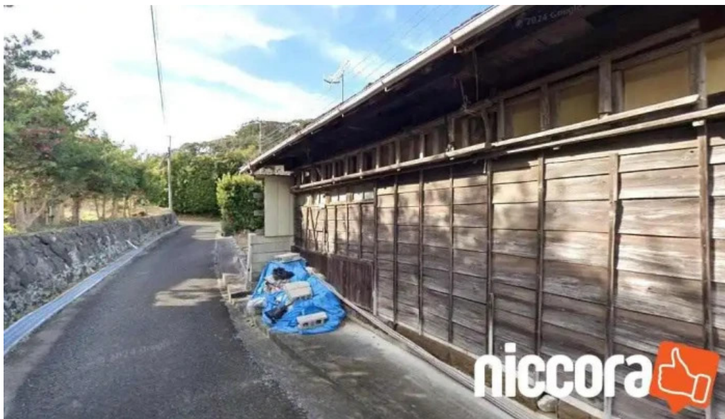
株式会社ベジデポ 館山市