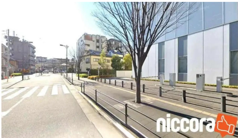
株式会社アバンテージ 足立区