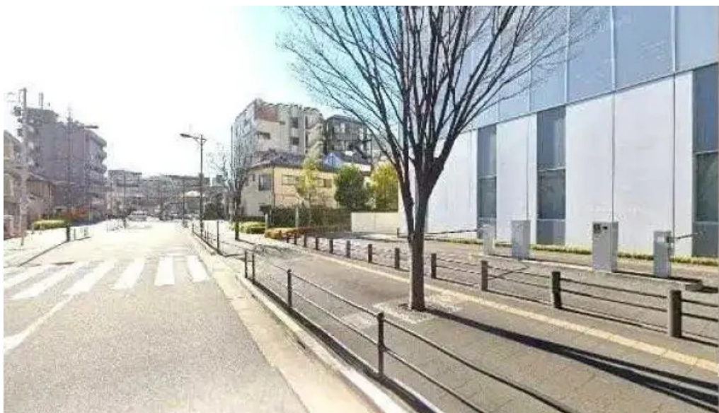
Zhu Shi Hui She abante zi subete