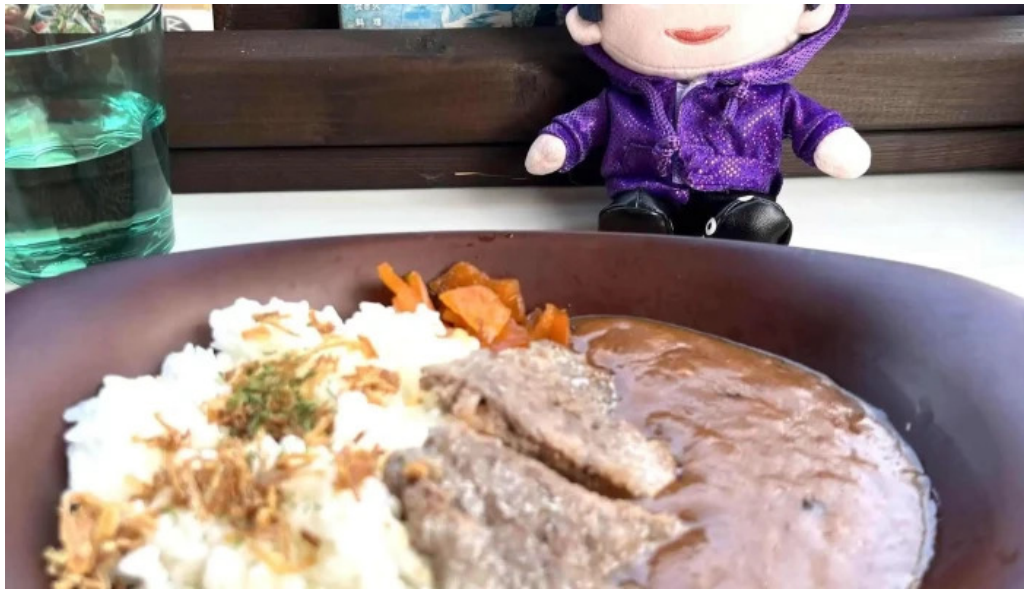
Tateyama base どこ