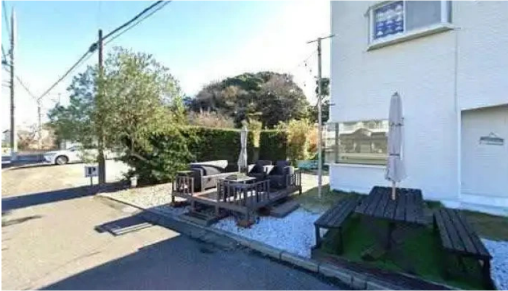
Tateyama base sutori tobiyu to 360deg biyu