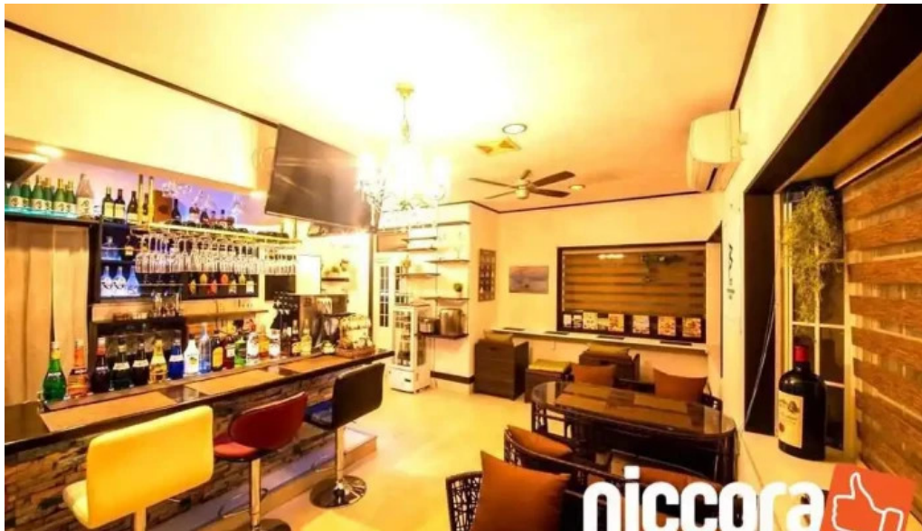
Tateyama base Fen Wei Qi