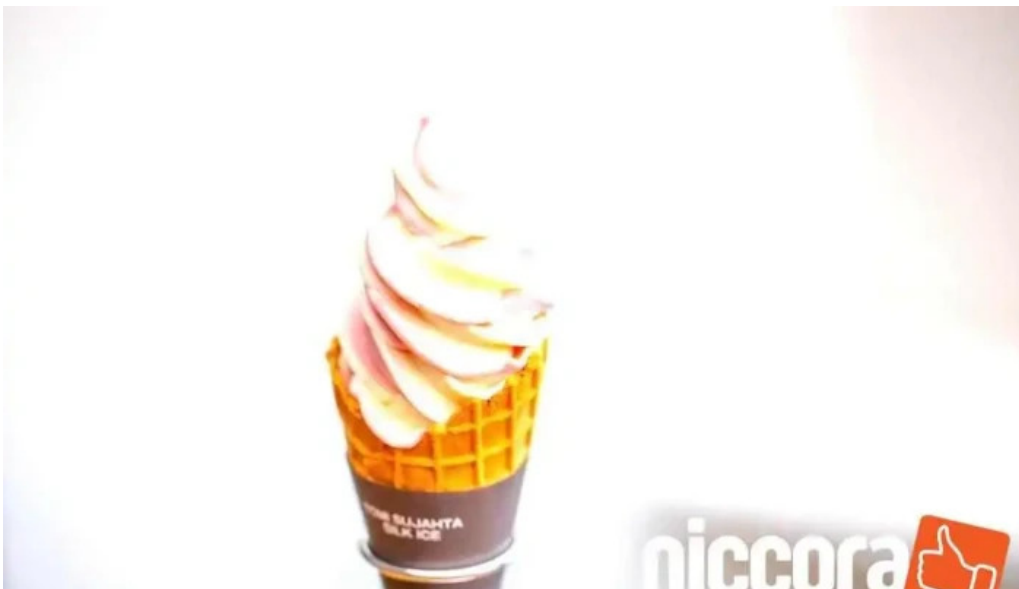
Tateyama base aisukuri mu