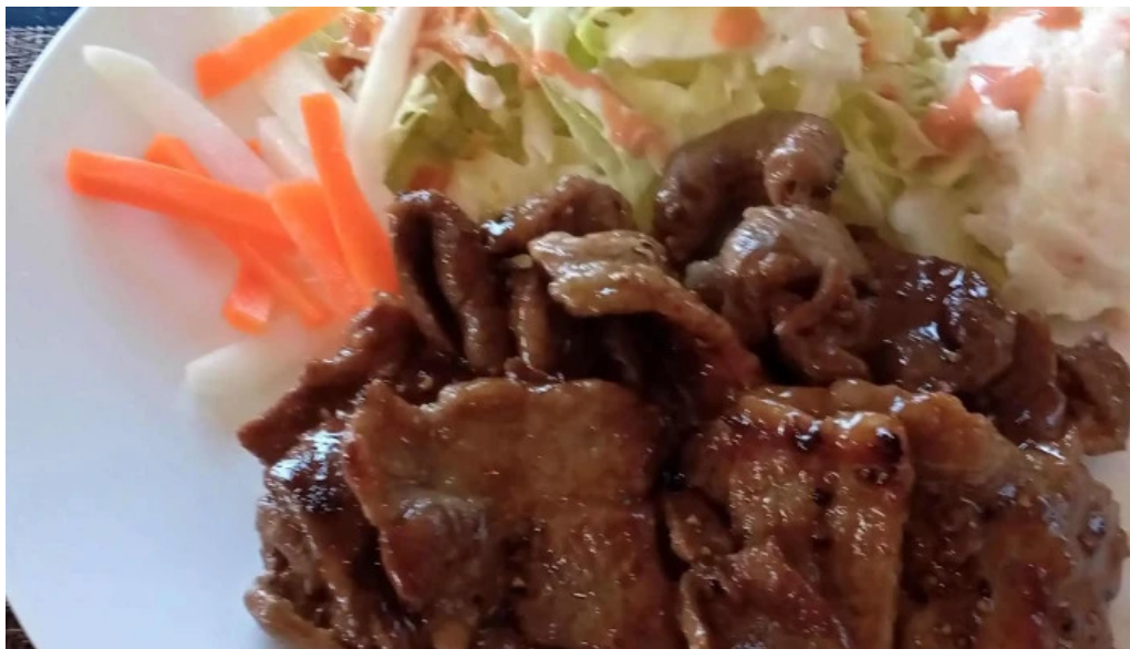
Tateyama base 館山市