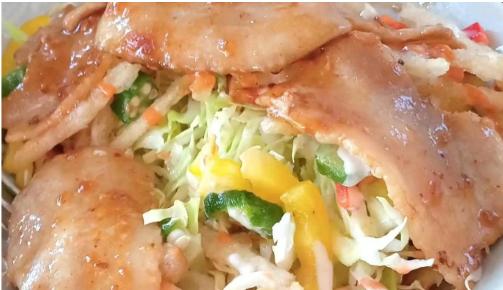
Tateyama base カフェ・喫茶