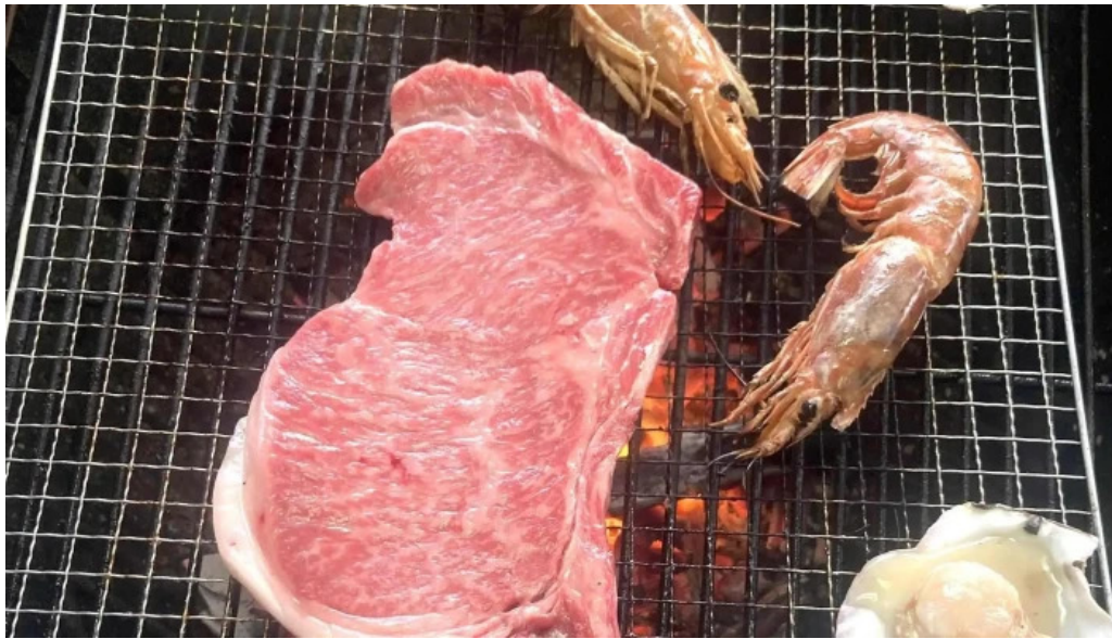
Tateyama base エリア