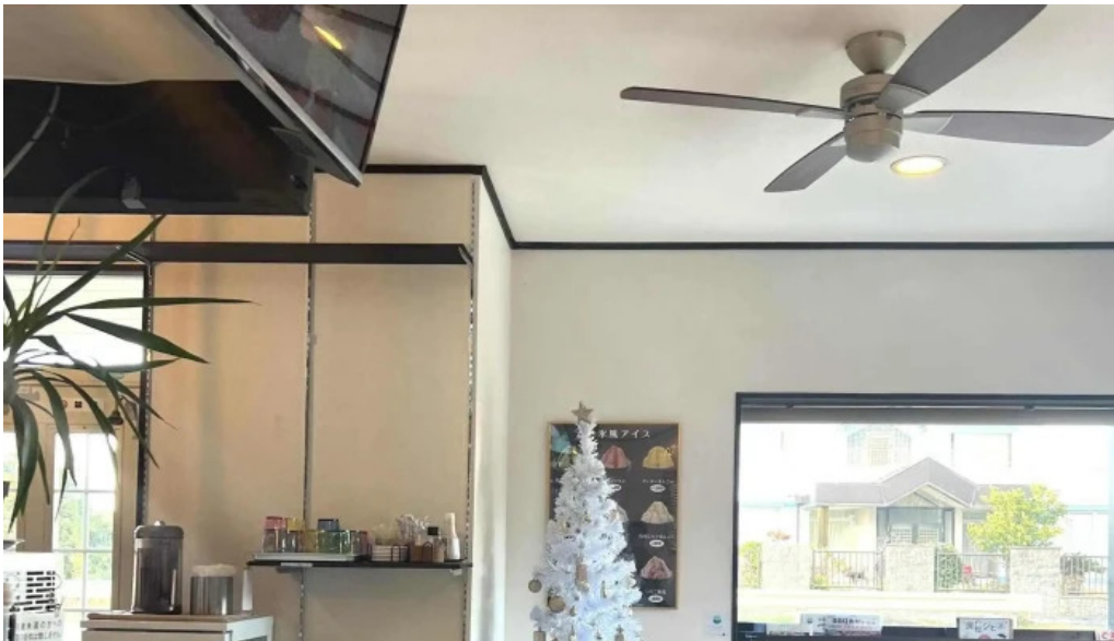
Tateyama base 近く