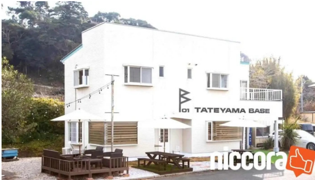
Tateyama base o na Ti Gong