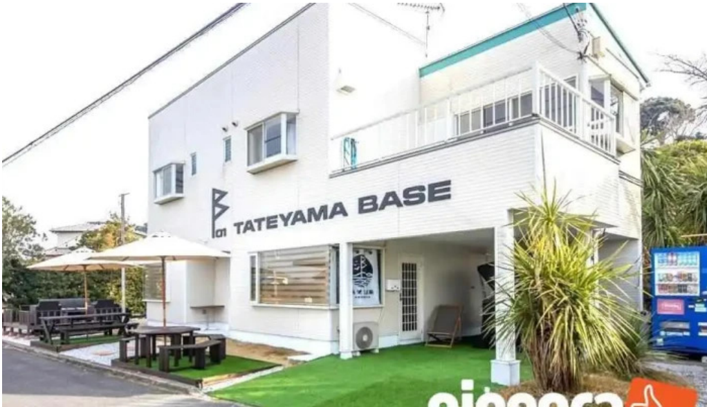
Tateyama base subete