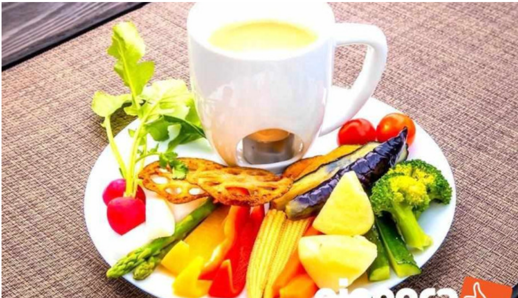
Tateyama base ba niyakauda