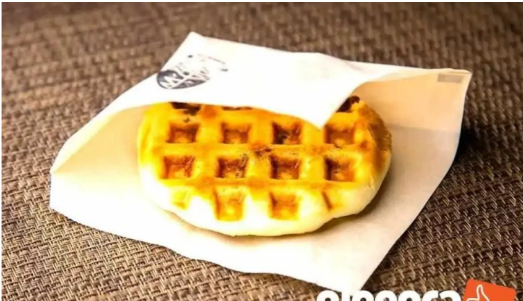
Tateyama base Liao Li Yin miWu