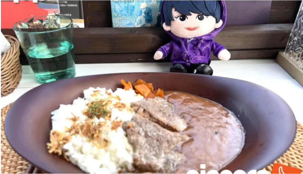
Tateyama base Zui Xin