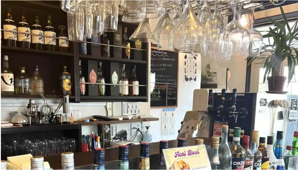
Tateyama base 割引