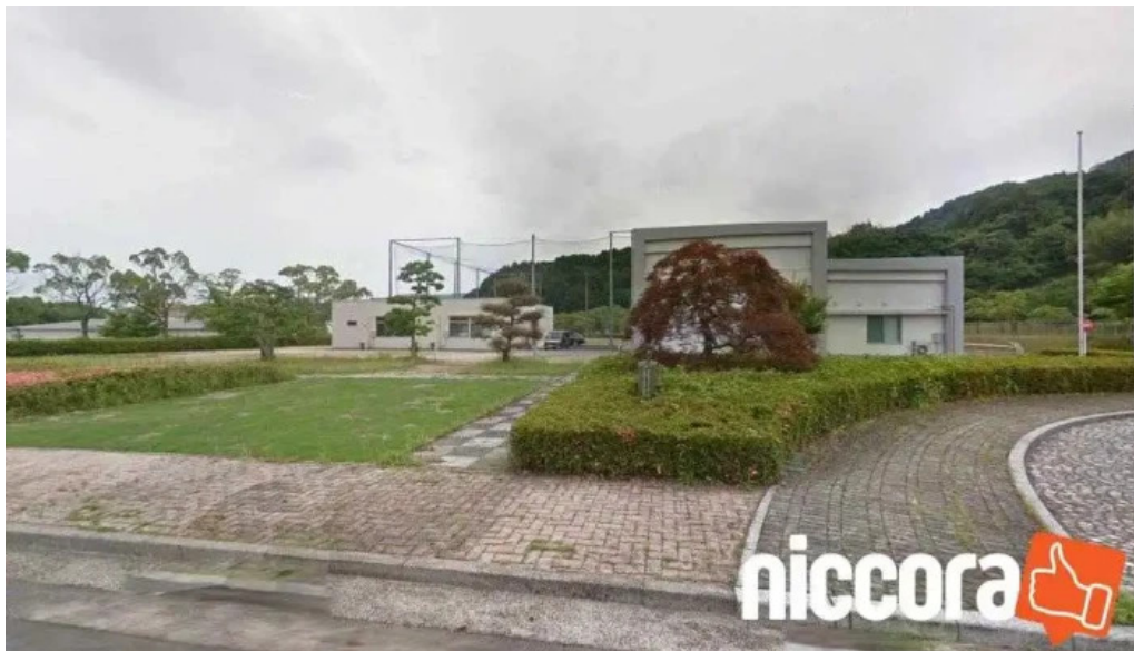
Inpit大分県知財総合支援窓口 大分市