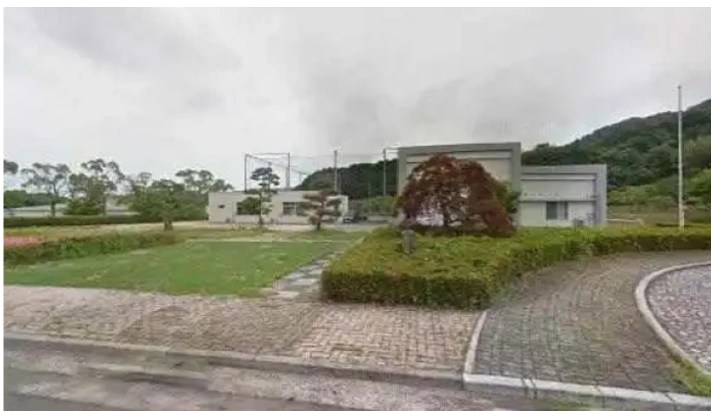
InpitDa Fen Xian Zhi Cai Zong He Zhi Yuan Chuang Kou subete

InpitDa Fen Xian Zhi Cai Zong He Zhi Yuan Chuang Kou 地図