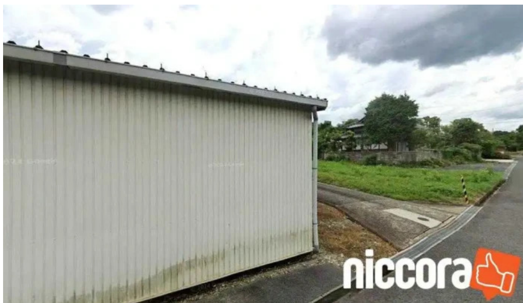
Ictサポートk a 津山市