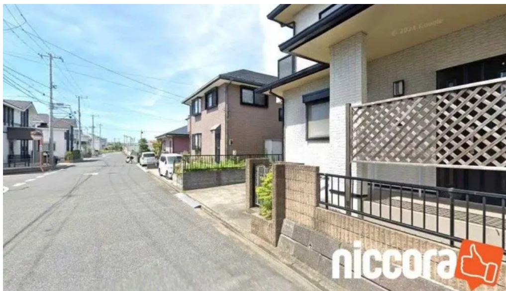
Ditマーケティングサービス（株）君津オフィス 君津市