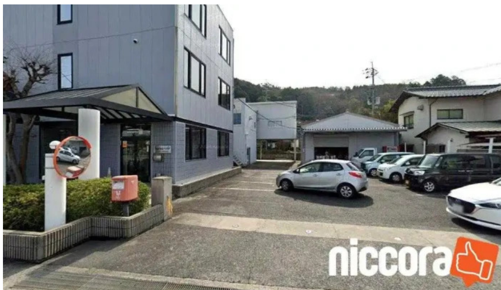
アスクラボ 株 本社 津山市