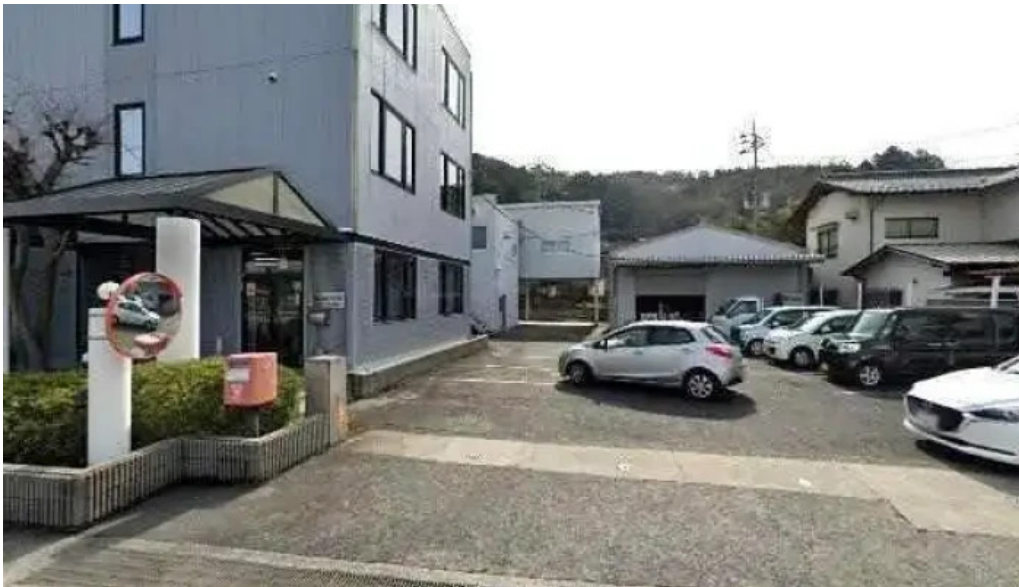
AsukuraboZhu Ben She subete