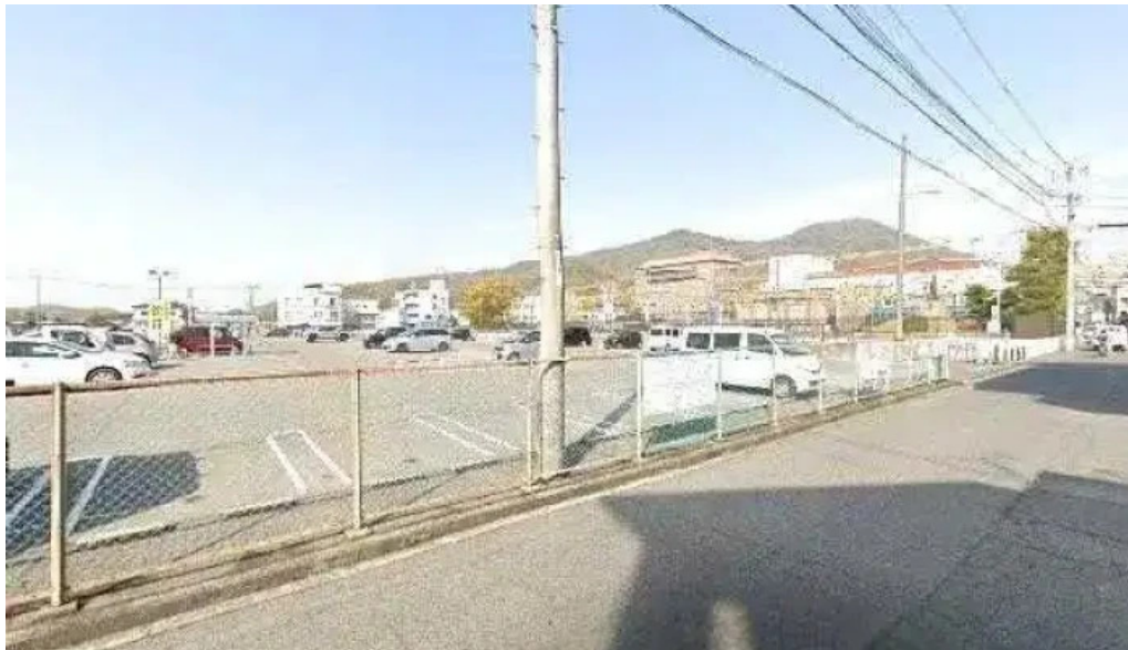
Pasokondotsuku24 Zhu Yuan Dian sutori tobiyu to 360 biyu