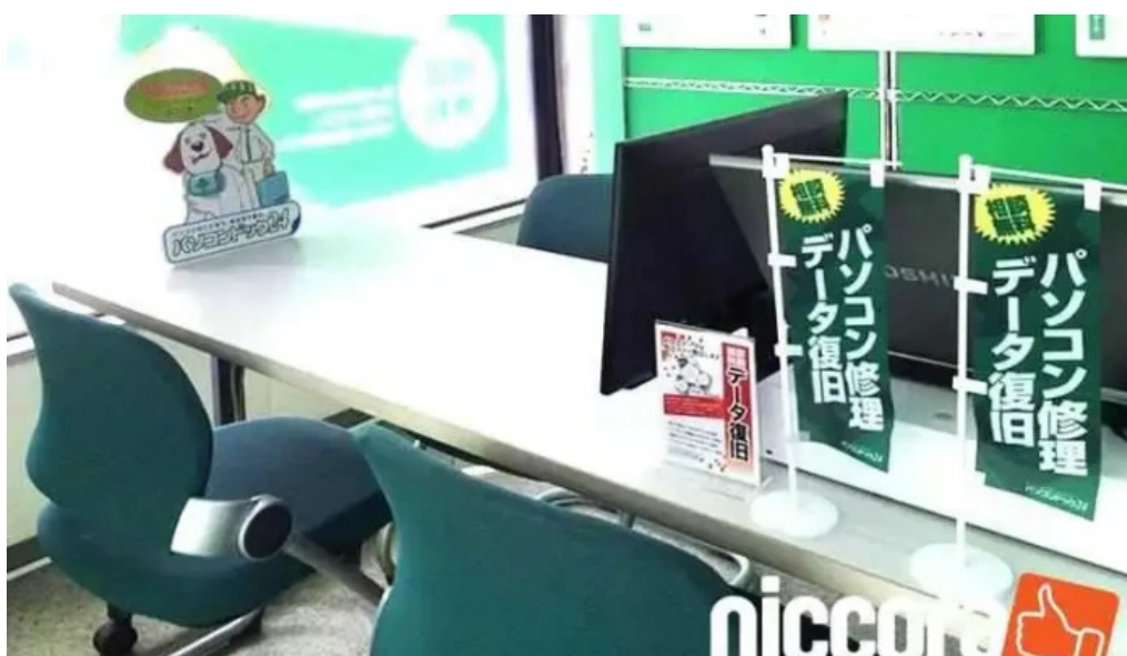
Pasokondotsuku24 Zhu Yuan Dian o na Ti Gong