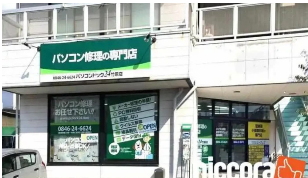
Pasokondotsuku24 Zhu Yuan Dian subete