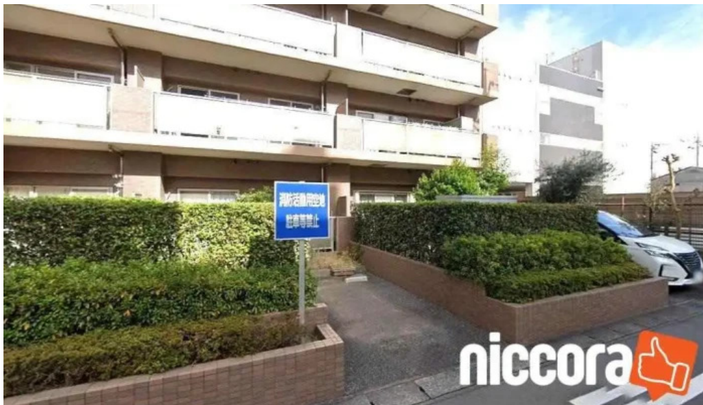
(株) コンサルティング・オブ・デルタ 千葉市