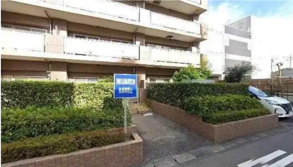
Zhu konsaruteinguobuderuta subete