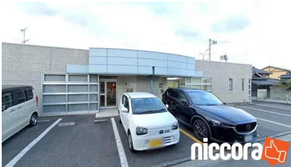
わたサポ 株 岡山市