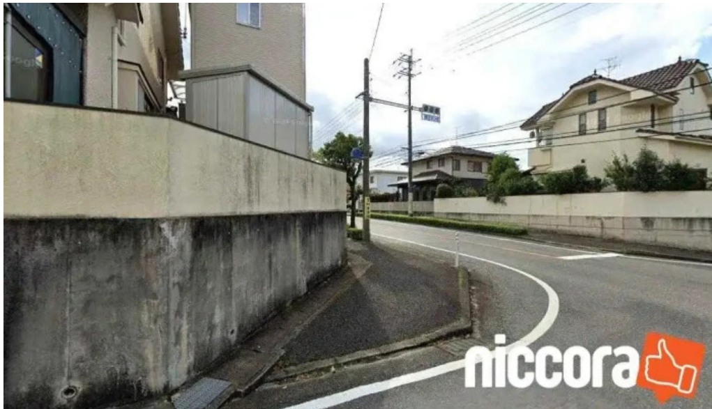
株 アイ・ティー・シー 岡山市