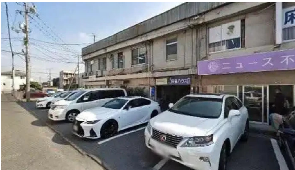
Zhu Dong Ya Ce Liang She Ji konsarutanto subete