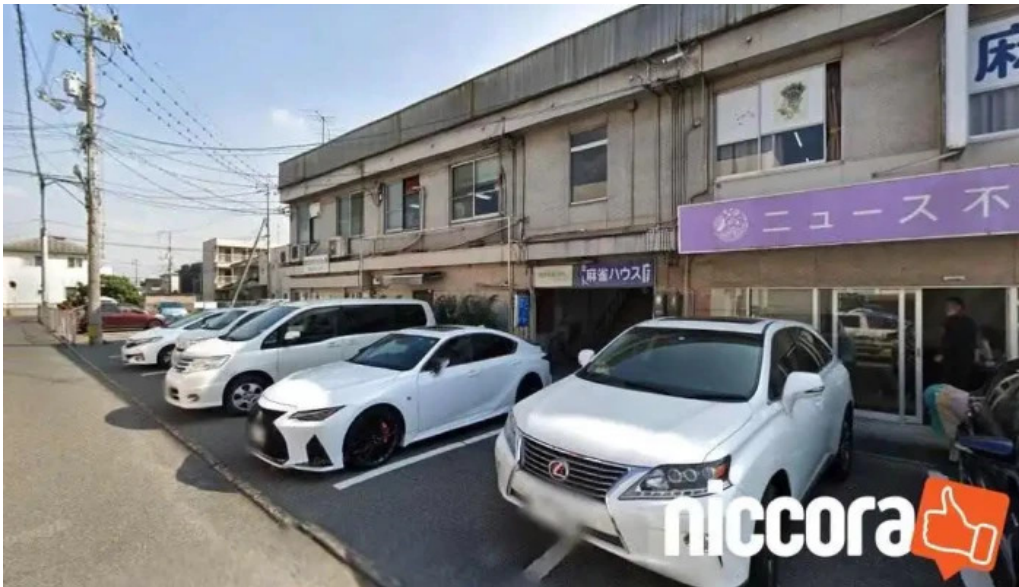
株 東亜測量設計コンサルタント 倉敷市