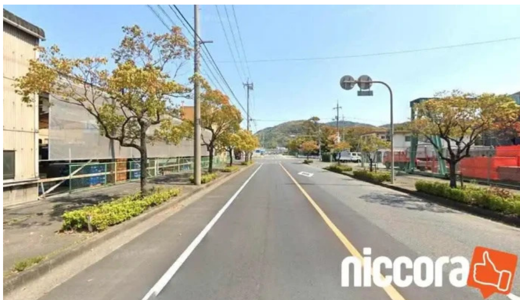
株 水島測量設計コンサルタント 倉敷市