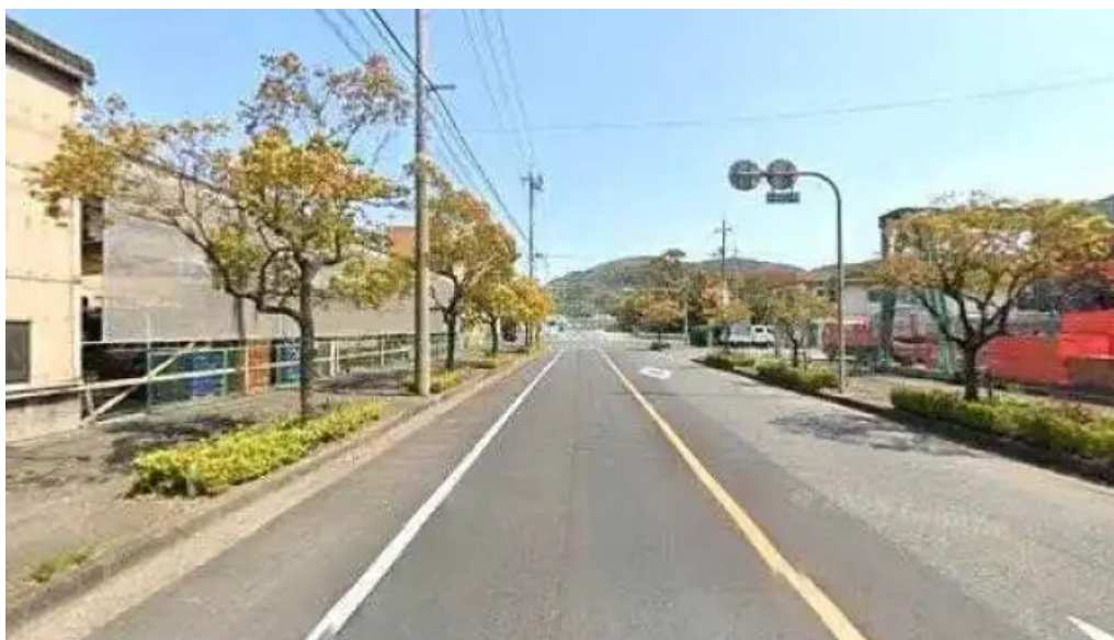
Zhu Shui Dao Ce Liang She Ji konsarutanto subete