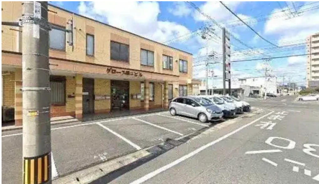
SetouchiGuo Ji Te Xu Shi Wu Suo Zui Xin