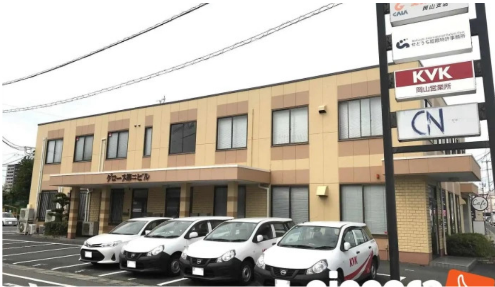
SetouchiGuo Ji Te Xu Shi Wu Suo subete