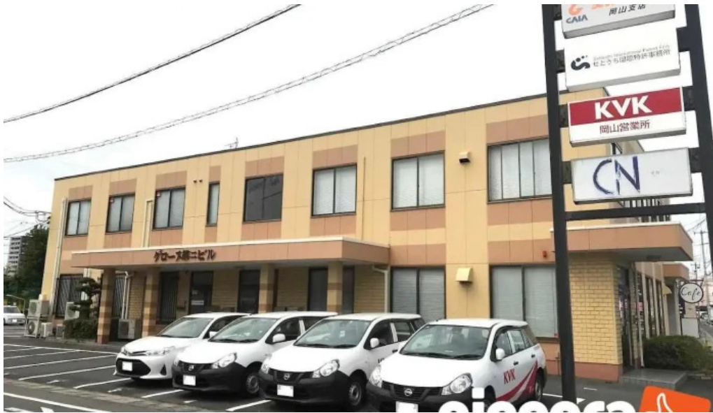
せとうち国際特許事務所 岡山市