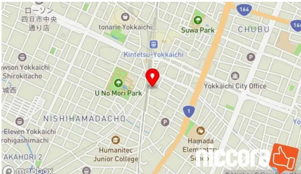
Si Ri Shi sgFa Lu Shi Wu Suo 地図