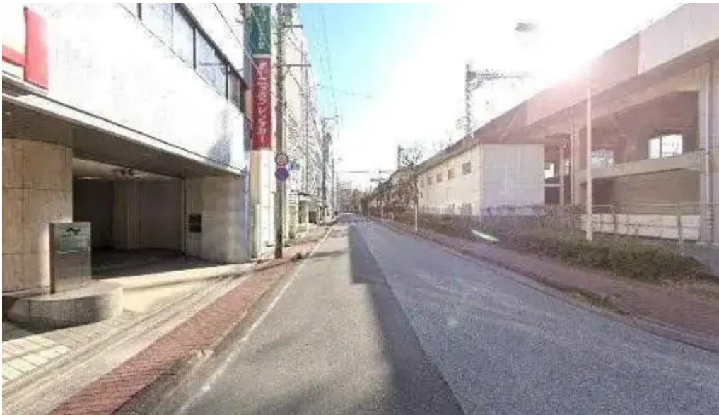
Si Ri Shi sgFa Lu Shi Wu Suo subete