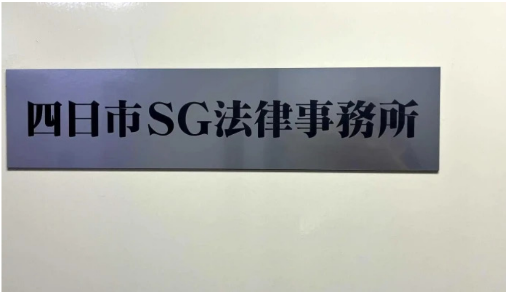
Si Ri Shi sgFa Lu Shi Wu Suo 法律事務所