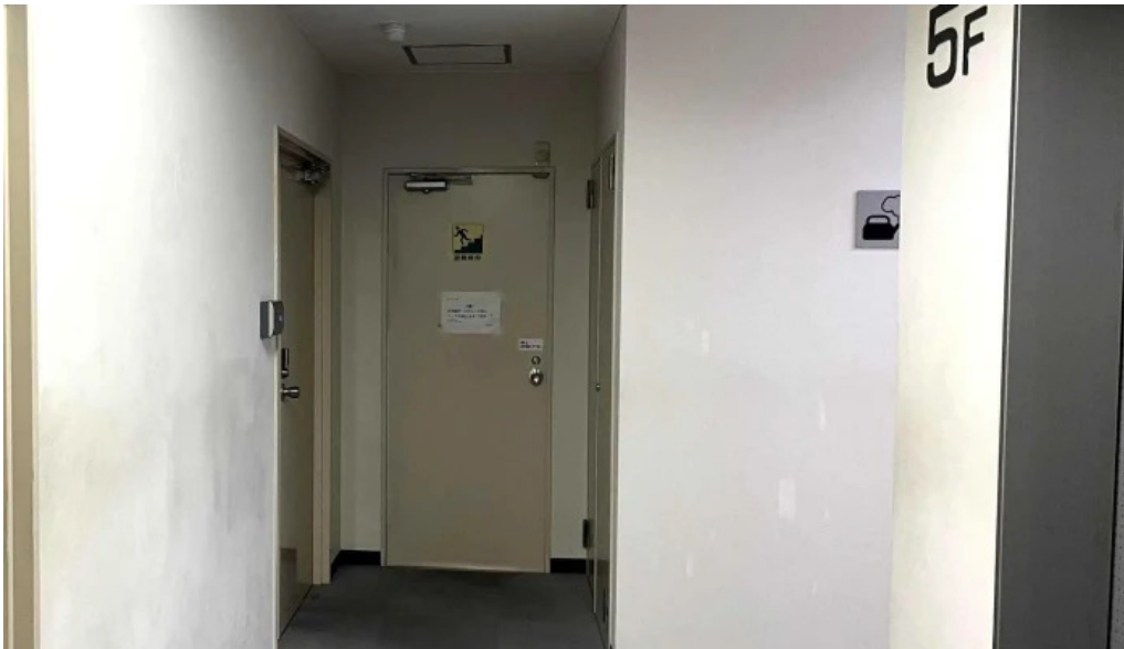
Si Ri Shi sgFa Lu Shi Wu Suo 四日市市