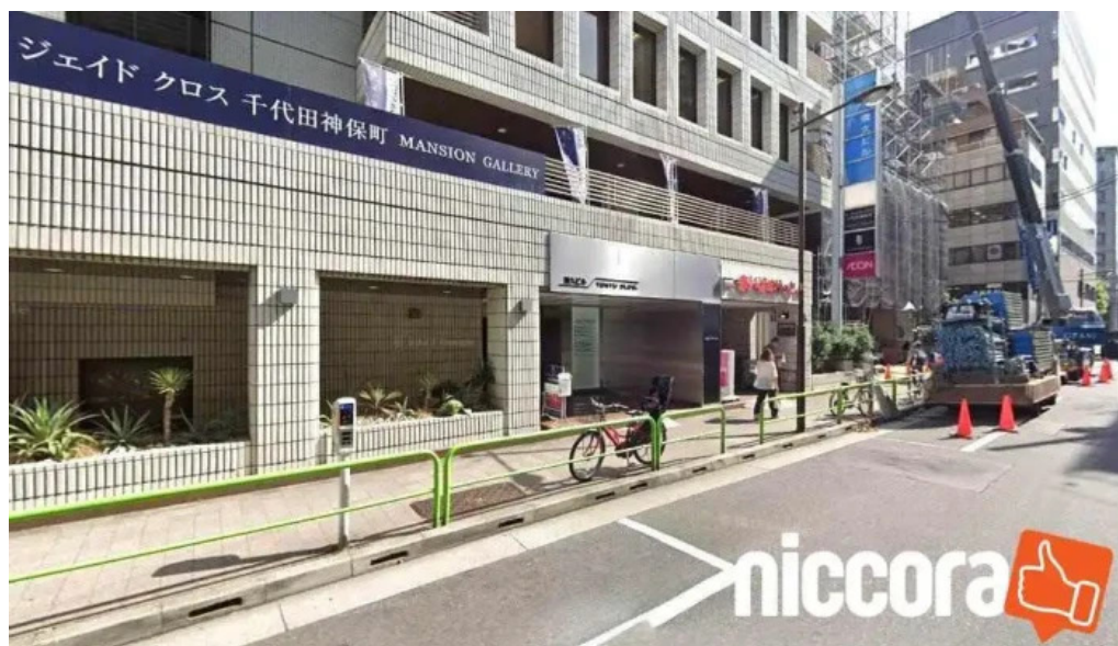
税務調査のご相談なら東京都千代田区の株式会社タックスコンサルティング 千代田区