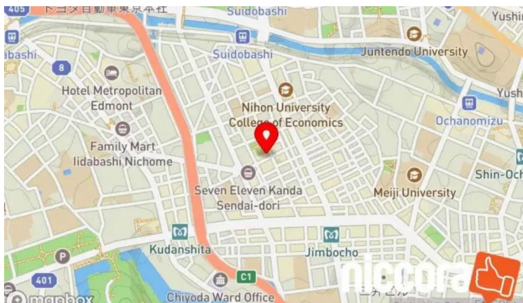
Wu Diao Cha nogoXiang Tan naraDong Jing Du Qian Dai Tian Qu noZhu Shi Hui She tatsukusukonsaruteingu