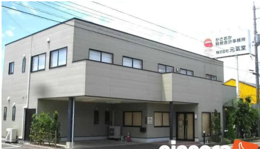
笠岡税務会計事務所 米子市