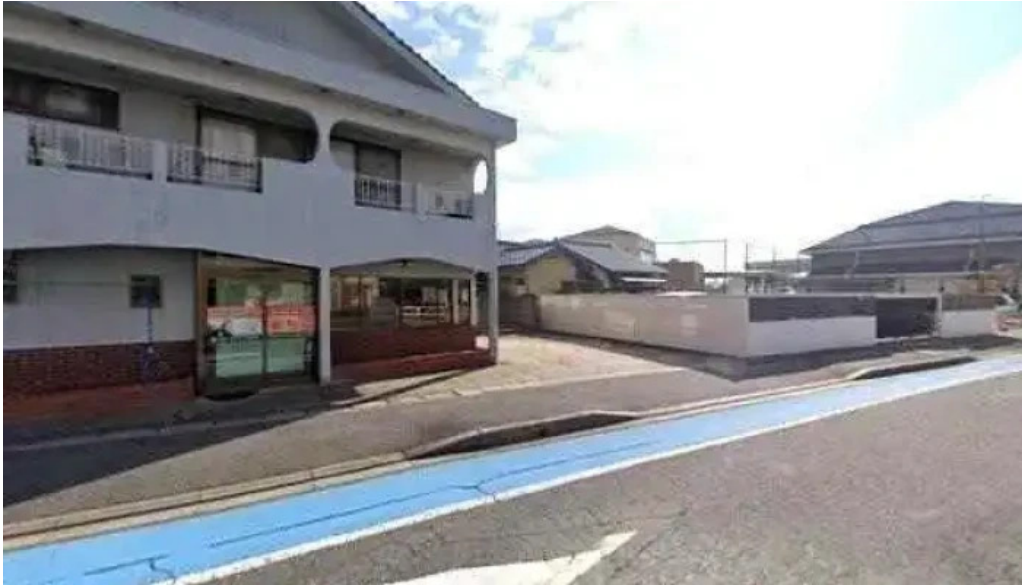
Li Gang Shui Wu Hui Ji Shi Wu Suo sutori tobiyu to 360 biyu