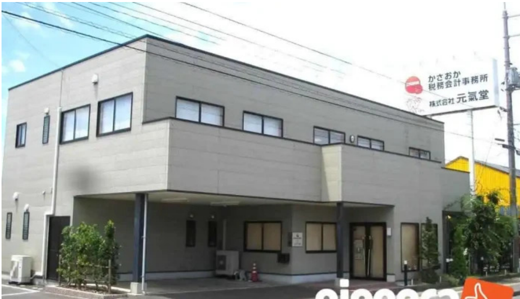
Li Gang Shui Wu Hui Ji Shi Wu Suo subete