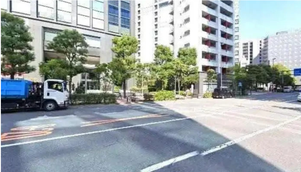
Zhu Shi Hui She third i subete