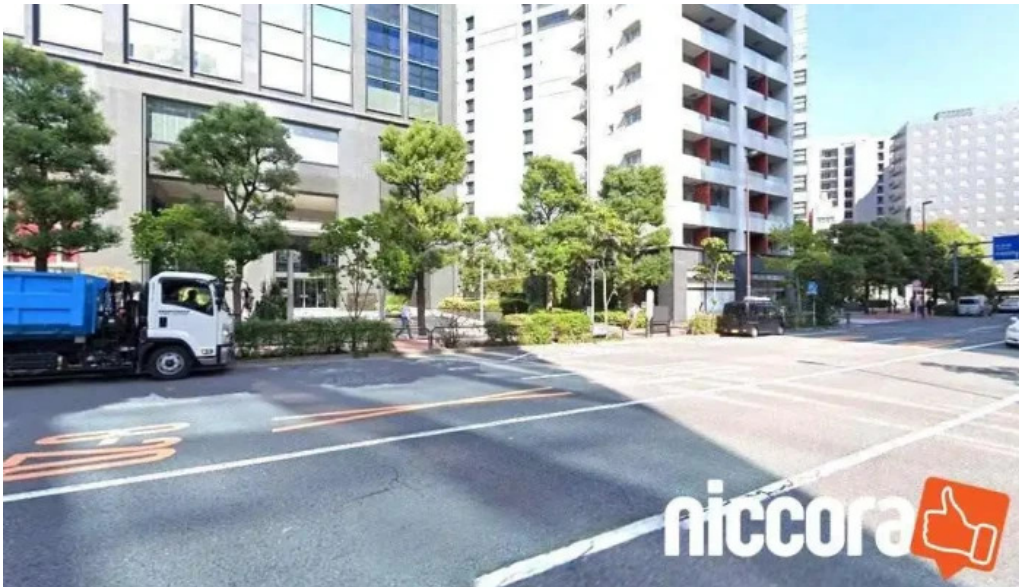
株式会社third i 千代田区